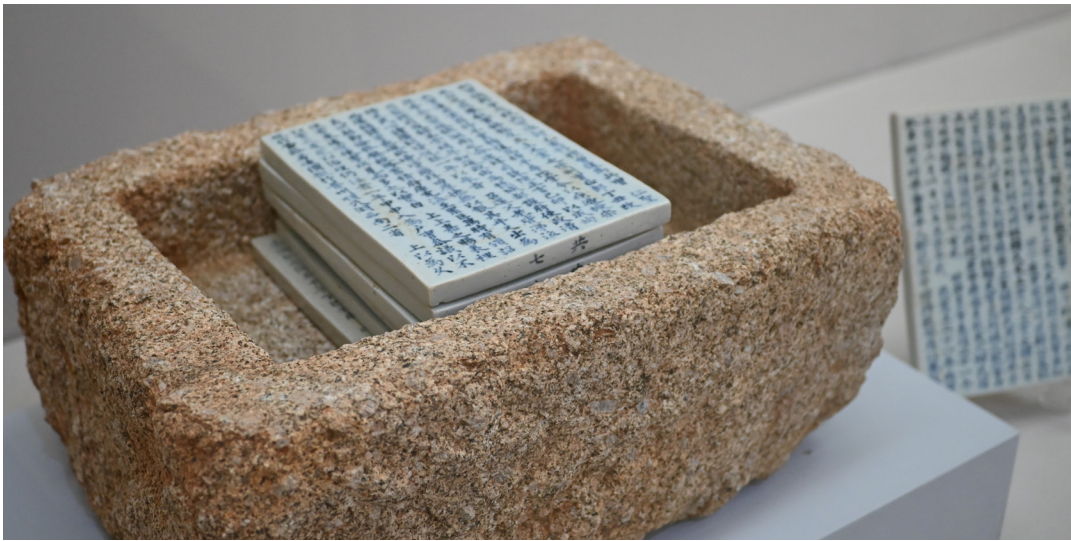
한준 석함 17c | 32X40X19cm | 한태호(청주 한씨 이양공·청평군파 종중) 기증 한준 청화백자묘지명 17c | 14X21.5X1cm | 한태호(청주 한씨 이양공·청평군파 종중) 기증

청주 한씨 이양공·청평군파 종중(한태호) 기증 유물 소개(한준 석함·청화백자묘지명 2건 9점) 글 | 전현정(부천시립박물관 학예사)