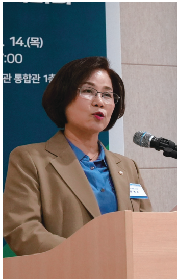
최옥순 | 부천시의회 시의원