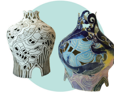
김찬희 | 숨길