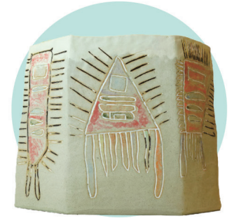
양병창 | 희망을 실어나가는 로켓