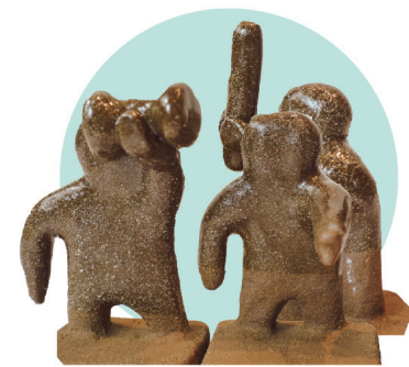
정다한 | 우리들은 사람, 그리고 표현의 자유!