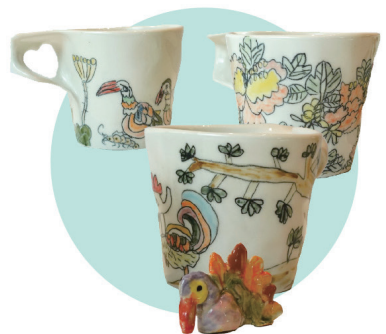
정현정 | 꽃과 새 그리고 맛있는 차